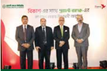
বিকাশ এর সাথে পূবালী ব্যাংক লিঃ এর লেনদেন সেবার শুভ উদ্বোধন