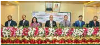
নেত্রকোণায় মানিলভারিং প্রতিরোধ বিষয়ক কর্মশালা

সম্প্রতি বাংলাদেশ ফিন্যান্সিয়াল ইন্সটিটিউশন ইউনিট (বিএফআইইউ) কর্তৃক আয়োজিত লীড ব্যাংক হিসেবে পূবালী ব্যাংক লিমিটেডের ব্যবস্থাপনায় নেত্রকোণার ২০টি তহসিলি ব্যাংকের ৬৭ জন প্রতিনিধি নিয়ে নেত্রকোনা সার্কিট হাউজের অডিটোরিয়ামে Prevention of Money Laundering and Combating the Finance of Terrorism (CFT & Related Issues) বিষয়ক কর্মশালা অনুষ্ঠিত হয়। কর্মশালার উদ্বোধন করেন অনুষ্ঠানের প্রধান অতিথি পূবালী ব্যাংক লিমিটেডের ব্যবস্থাপনা পরিচালক ও প্রধান