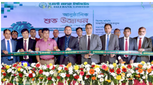
জিজিরা উপশাখা, ঢাকা