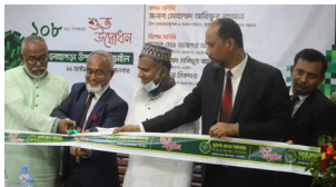
লোহাগড়া উপশাখা, নড়াইল