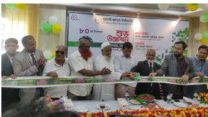
বামুন্দি উপশাখা, গান্ধি, মেহেরপুর