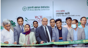
বড় মগবাজার উপশাখা, ঢাকা

আর্থিক অন্তর্ভুক্তি কার্যক্রম এবং প্রত্যন্ত এলাকায় সর্বোত্তম ব্যাংকিং সেবা প্রদানের প্রত্যয় নিয়ে দেশব্যাপী উপশাখা সম্প্রসারণ জোরদার করেছে পূবালী ব্যাংক লিমিটেড। ২০২০ সালের জানুয়ারীতে ব্যাংক ফেনীর পরশুরামে প্রথম উপশাখা চালু করে এবং ডিসেম্বর ২০২২ পর্যন্ত দেশব্যাপী ১২৭ টি উপশাখা অনলাইন সুবিধা সহ গ্রাহকদের সকল ব্যাংকিং চাহিদা পূরণ করে আসছে। সম্প্রতি উদ্বোধন হওয়া উল্লেখযোগ্য উপশাখাসমূহঃ