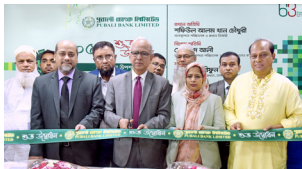
নন্দীপাড়া উপশাখা, ঢাকা