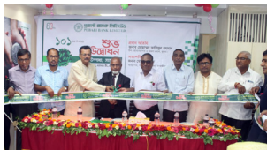
তালা উপশাখা, সাতক্ষীরা