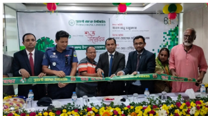
কলামাকান্দা উপশাখা, নেত্রকোনা