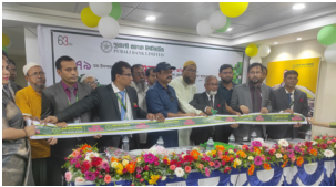
দর্শনা উপশাখা, চুয়াডাঙ্গা