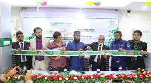
কোট চাঁদপুর উপশাখা, বিনাইদহ