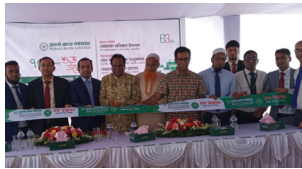
ঘাটাইল উপশাখা, টাংগাইল