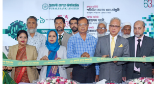
আফতাব নগর উপশাখা, ঢাকা