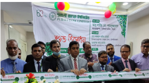
ইনাতগঞ্জ উপশাখা, নবীগঞ্জ, হবিগঞ্জ