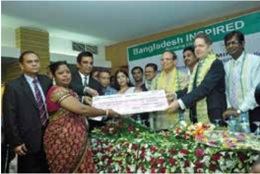
এসএমই ও নারী উদ্যোক্তা ঋণ বিতরণে কৃতিত্বপূর্ণ অবদানের জন্য বাংলাদেশ ব্যাংক এর স্বীকৃতি