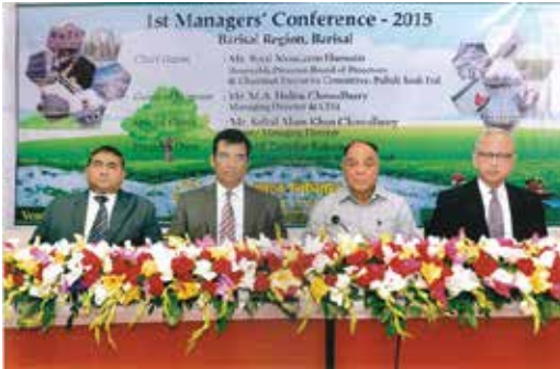
পূবালী ব্যাংক লিমিটেডের বরিশাল অঞ্চলের '১ম শাখা ব্যবস্থাপক সম্মেলন-২০১৫' অনুষ্ঠিত