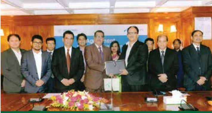
পূবালী ব্যাংক লিঃ এবং গ্রামীণফোন লিঃ এর মধ্যে Business Solutions সংক্রান্ত চুক্তি স্বাক্ষরিত