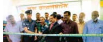
দৌলতপুর শাখা, মানিকগঞ্জ এর নতুন ভবনের শুভ দ্বারোদঘাটন

খুলনা অঞ্চলাধীন ২৮টি শাখার ব্যবস্থাপক ও কর্মকর্তাগণ দিনব্যাপী এ কর্মশালায় অংশ নেন। অনুষ্ঠানে বক্তারা মানি লডারিং ও সন্ত্রাসী কাজে অর্থায়ন প্রতিরোধে ব্যাংক কর্মকর্তাদের সচেতন ভাবে কাজ করার আহবান জানান। এ ব্যাপারে বাংলাদেশ ব্যাংক ও স্বশ্রীষ্ট প্রতিষ্ঠান আরোপিত দিক নির্দেশনাবলী সুষ্ঠুভাবে পরিপালনের জন্য তাগিদ দেয়া হয়।