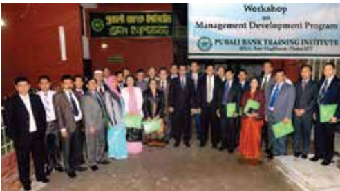
পূবালী ব্যাংক ট্রেনিং ইনস্টিটিউটের উদ্যোগে "Management Development Program" শীর্ষক প্রশিক্ষণ কর্মশালা

উল্লেখ্য, এই চুক্তির ফলে পূবালী ব্যাংক লিমিটেড এবং ব্যাংকের সকল পর্যায়ের কর্মকর্তা ও কর্মচারীবৃন্দ দ্রুতগতির সেবার পাশাপাশি Voice Communication, FnF, High speed 3G Internet, Data Connectivity, Handset সহ সাশ্রয়ী মূল্যে আধুনিক সুযোগ-সুবিধা উপভোগ করবেন।