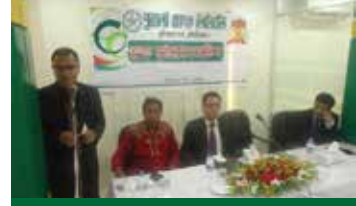
মৌলভীবাজারের মুন্সীবাজারে পূবালী ব্যাংক লিঃ এর ৪৩৫ তম শাখার শুভ উদ্বোধন