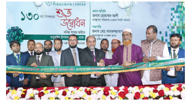
মাতুয়াইল উপশাখা, ঢাকা

আর্থিক অন্তর্ভুক্তি কার্যক্রম এবং প্রত্যন্ত এলাকায় সর্বোত্তম ব্যাংকিং সেবা প্রদানের প্রত্যয় নিয়ে দেশব্যাপী উপশাখা সম্প্রসারণ জোরদার করেছে পূবালী ব্যাংক লিমিটেড। ২০২০ সালের জানুয়ারীতে ব্যাংক ফেনীর পরশুরামে প্রথম উপশাখা চালু করে এবং বর্তমানে মে ২০২৩ পর্যন্ত দেশব্যাপী ১৫৪ টি উপশাখা অনলাইন সুবিধা সহ গ্রাহকদের সকল ব্যাংকিং চাহিদা পূরণ করে আসছে। সম্প্রতি উদ্বোধন হলো উল্লেখযোগ্য উপশাখাঃ