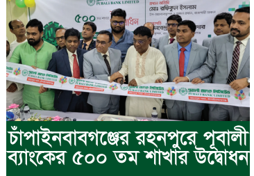
চাঁপাইনবাবগঞ্জের রহনপুরে পূবালী ব্যাংকের ৫০০ তম শাখার উদ্বোধন