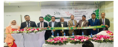
ইসলামপুর উপশাখা, জামালপুর