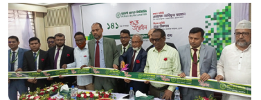
নলতা উপশাখা, সাতক্ষীরা