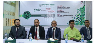
হরিণাকুন্ডু উপশাখা, বিনাইদহ