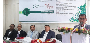
নকলা উপশাখা, শেরপুর